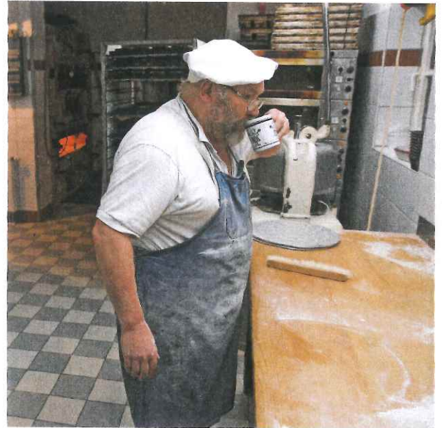
In guten Händen: Was die Backstube verlässt, muss seinen Qualitätsansprüchen genügen.

gleichsweise kühl. Mittwoch ist deshalb auch der Croissant-Tag. Zwei, drei Tage später, wenn das Wochenpensum des Loretto-Bäckers auf seinen hitzigen Höhepunkt zusteuert und es 15 Grad wärmer ist, kann er hier nicht mehr mit Butter arbeiten. Daran spart Weber bei seinen Croissants nicht. „450 Gramm auf ein Kilo Mehl – das absolute Luxusrezept.“ Die arbeitet er in insgesamt 18 Schichten mit dem Wellholz in den kühlen Teig ein. „Wenn ich mir das Geschäft schon mache, dann gleich richtig.“ Dass die Loretto-