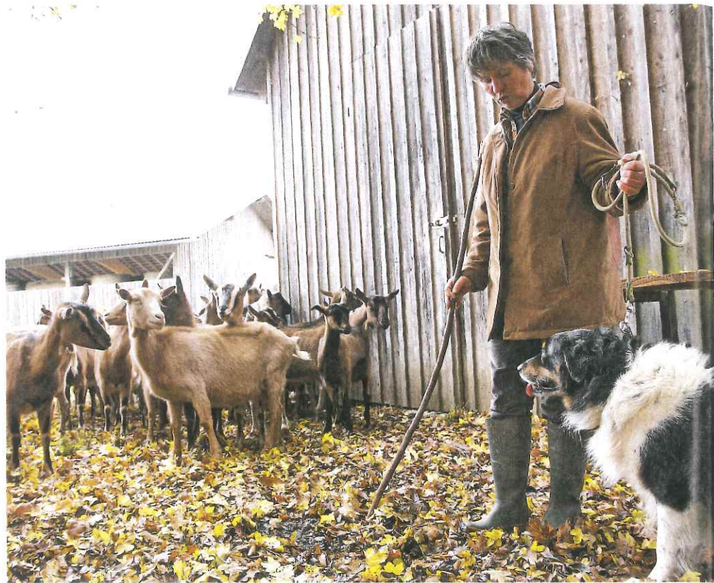
Gemischtes Doppel: Der Ziegenkäse zum Brot stammt ebenfalls vom Lorettohof.