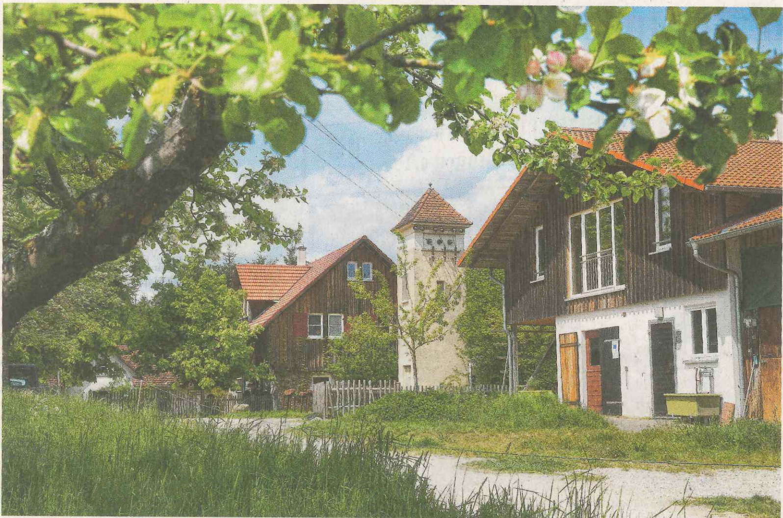
Der Loretto-Hof oberhalb Zwiefaltens gehört zu den „50 Traumzielen vor der Haustür“ im „Stern“.